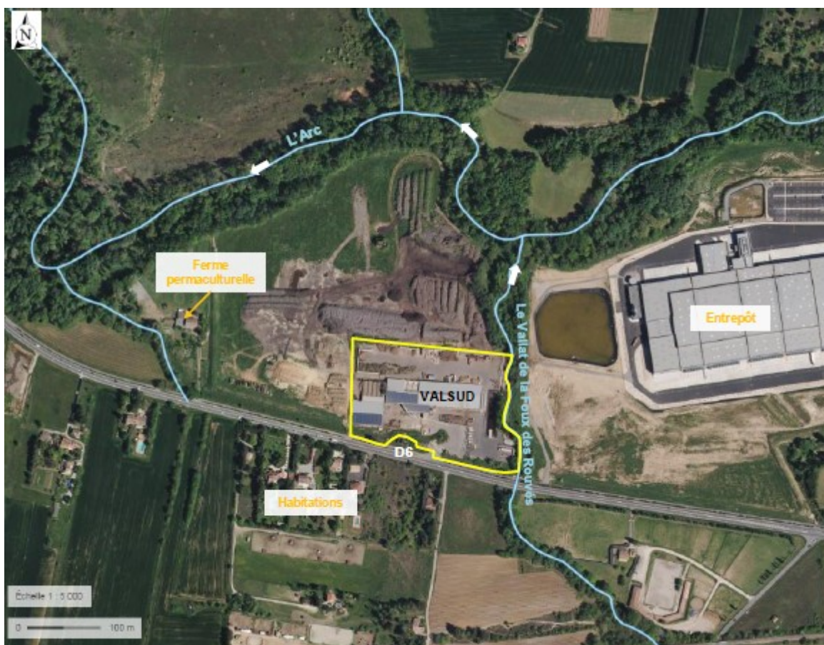
Figure 2: Abords immédiats du site du projet

Le projet s'inscrit dans un contexte semi-rural. Il est bordé, à l'est, par le ruisseau du Vallat de la Foux des Rouvés (affluent de l'Arc) et sa ripisylve, qui matérialise la limite de propriété du projet et au sud par la route départementale D6. Des habitations sont présentes de l'autre côté de la route départementale.